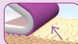
Sin desprendimiento de piel con la Tecnología Safetac