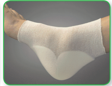
Si fuera necesario, asegurar Mepilex Heel con un vendaje u otra fijación.