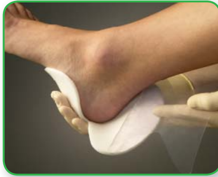
Mepilex Heel debe cubrir al menos 2 cm de piel perilesional. Aplicar la cara adherente sobre la herida. No estirar.