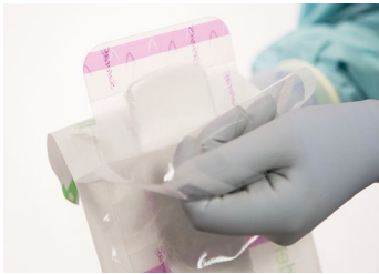
1. Abra el paquete estéril y retire el apósito