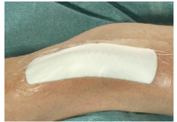
4. Finalizar la aplicación presionando el apósito para lograr la máxima adherencia.