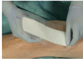
2. Retire la parte más pequeña del film protector y fije Mepilex Border Post-Op en la piel.