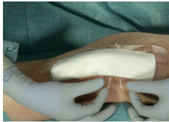
3. Retire el film despegable completamente y aplique el resto del apósito sobre la piel.